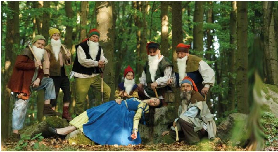
Schneewittchen und die sieben Zwerge (2023)