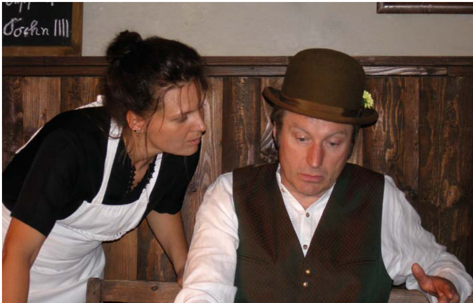
Glei heiratn moanst? —

In einem abgelegenen bayerischen Gebirgstal treibt ein Wilderer sein Unwesen. Die Obrigkeit tobt; denn ausgerechnet die kapitalsten Böcke holt er sich buchstäblich vor dessen Nase weg, lautlos und ohne Spuren zu hinterlassen.