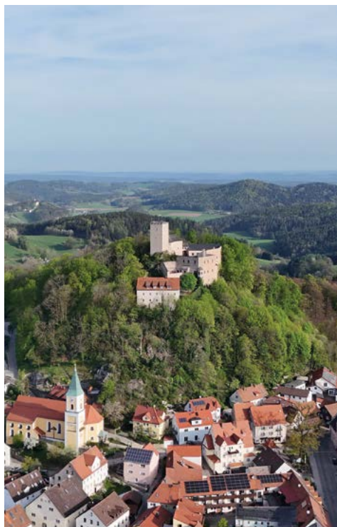
Blick auf die Burg Falkenstein