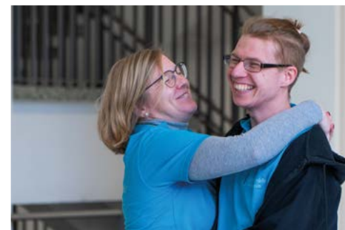
Szene aus einer Probe

Ansonsten hat Münchhausen es mit den raubgierigen Dichtern Bürger und Raspe zu tun, deren Anwälten und einer sehr jungen Braut, die ihn den letzten Groschen kostet.