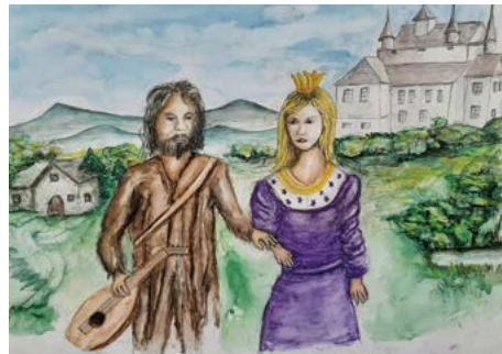
2025 auf der Bühne: „König Drosselbart“.