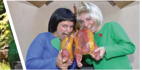
Böse Buben: „Max und Moritz“ (2016)