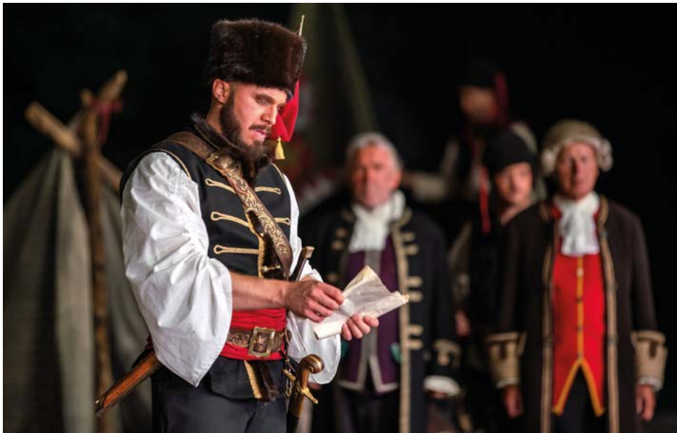
Freiherr von der Trenck belagert mit seinen wilden Panduren Waldmünchen. —

Zum 74. Mal reitet Freiherr Franziskus von der Trenck mit seinen wilden Panduren in diesem Sommer wieder auf der Freilichtbühne der Stadt Waldmünchen.