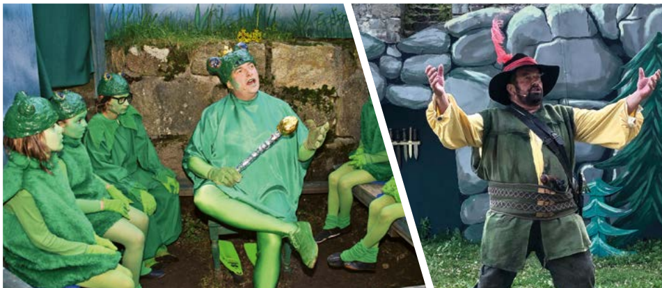
Der „Froschkönig“ in seinem Reich (2010)