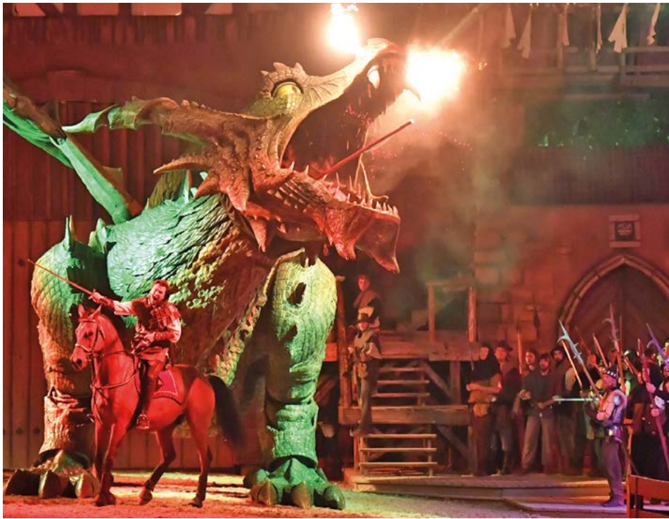
Kampf mit dem Drachen

In der Abenddämmerung des Mittelalters, an einem Sonntag im August 1431, wird in Furth im Wald Weltgeschichte geschrieben: