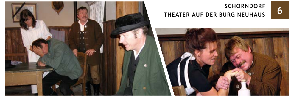
Was soll de Verhörerei? —