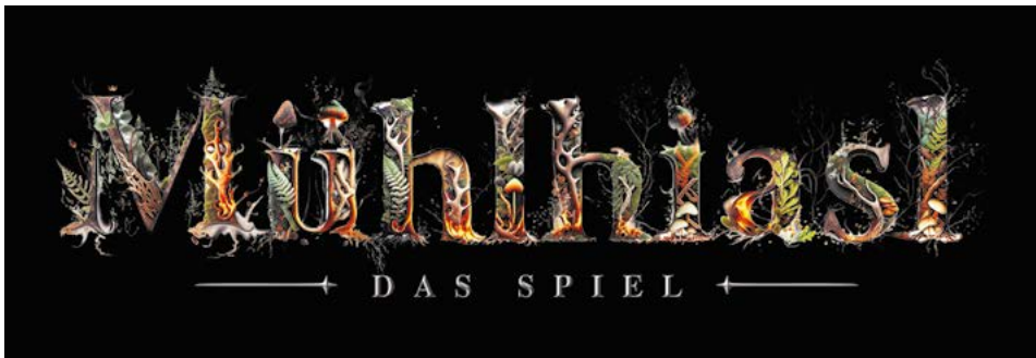
Der neue Schriftzug „Mühlhiasl – Das Spiel“. —

Das Publikum kann sich bei den Aufführungen des Lichtenegger Bundes im Juli und August 2025 auch auf ein völlig neues Bühnenbild einstellen. Die Technik ist ausgefeilt: Im Hintergrund der Bühne ist eine Berglandschaft angedeutet, die durch spezielle Lichtprojektionen völlig neue Darstellungsformen ermöglicht.