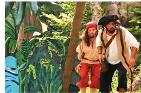
„Pippi in Taka-Tuka-Land“ (2024)