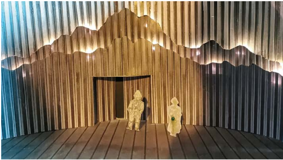
Entwurf des neuen Bühnenbilds. —

Der „Brandner Kaspar und das ewig' Leben“ verzauberte die Zuschauer auf Burg Lichtenegg und sorgte in den letzten Jahren für ausverkaufte Ränge. Nun tritt der „Mühlhiasl“ in seine Fußstapfen.