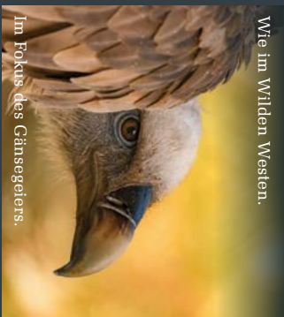
Im Fokus des Gänsegeiers.