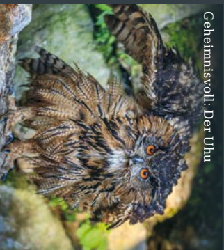
Geheimnisvoll: Der Uhu