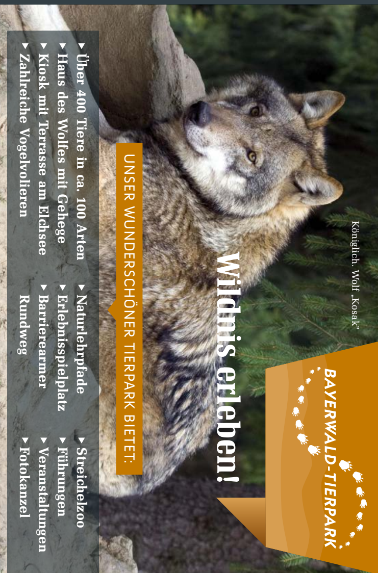
Königlich: Wolf „Kosak“