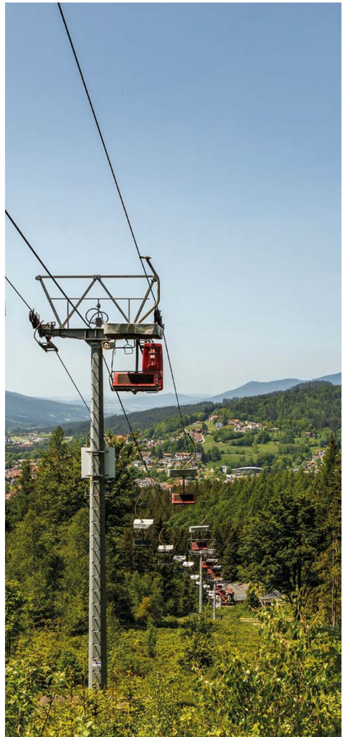
Silberberg bei Bodenmais: Besucherbergwerk – Bergbahn – Sommerrodelbahn